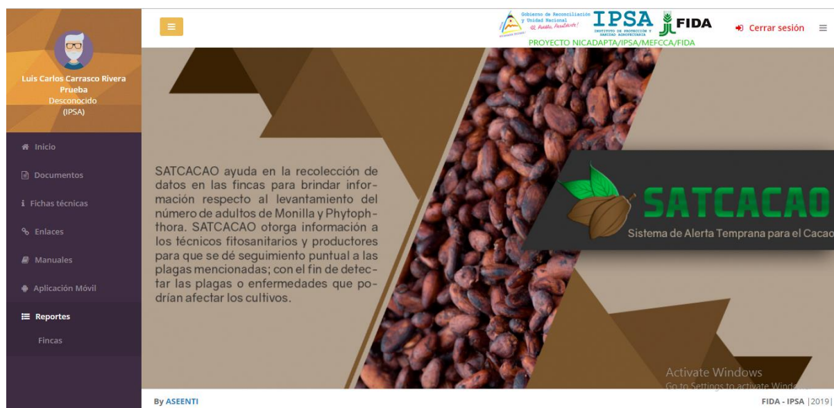
Figura 4. Ubicación del enlace para acceder al módulo de reportes.

La selección de reportes se localiza en el menú de navegación, si deseas visualizar el reporte necesitas acceder al reporte dentro del menú de navegación haciendo clic sobre dicho enlace.