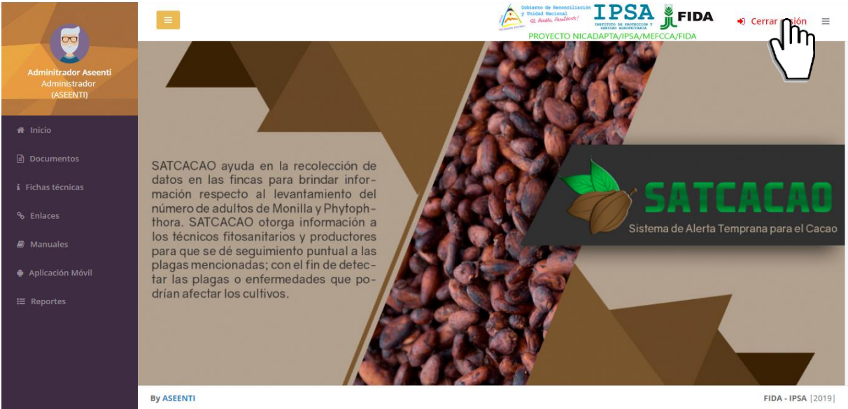
Figura 6. Ubicación del enlace para cerrar sesión dentro del sistema web privado.

Tras finalizar con todas las actividades, es muy importante cerrar la sesión de usuario en la plataforma. Para esto, es necesario hacer clic en cerrar sesión para finalizar su actividad. Al cerrar sesión, se asegura de que ningún usuario tenga acceso a un nivel que no le corresponde. Después de cerrar sesión aparecerá la página de identificación de nuevo. Es necesario dar clic en el botón cerrar sesión que se encuentra ubicado en la parte superior derecha del sitio tal como lo muestra la figura 6.