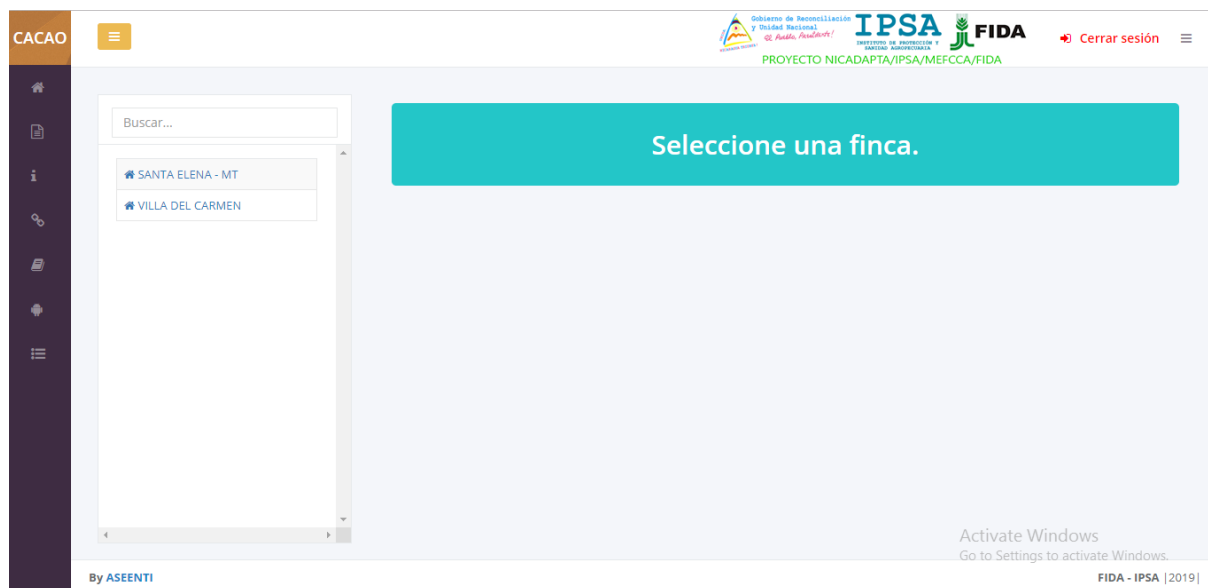
Figura 5. Vista previa del reporte general generado.