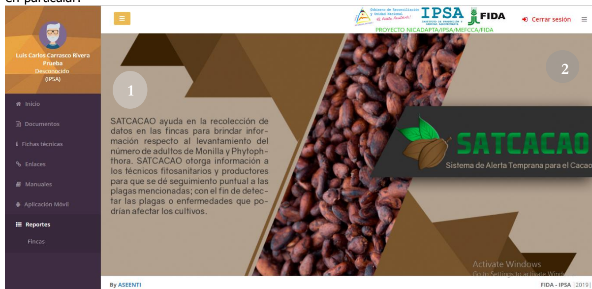
Figura 3. Localización de las funciones principales dentro del sitio web privado para el nivel mediante el cual se accedió.

Puede acceder a las opciones al presionarlas, estas le llevaran a secciones distintas para cada servicio en particular.