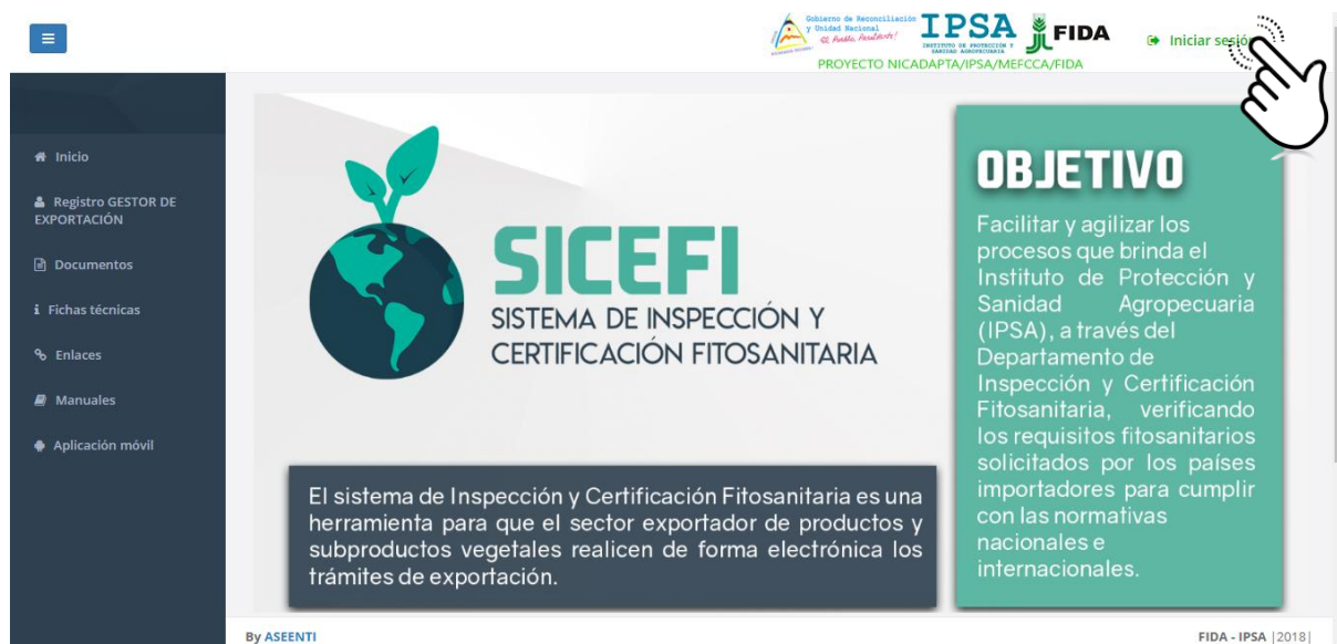
Figura 1. Página principal del sitio web público del sistema SICEFI.