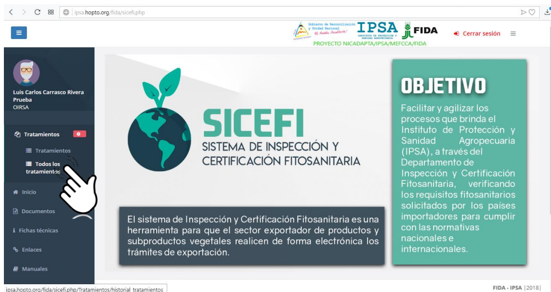
Figura 8. Ubicación del enlace para visualizar el total de tratamientos registrados.

El enlace para visualizar los tratamientos se encuentra disponible dentro del módulo de Tratamientos (Tratamientos > Todos los Tratamientos), la ubicación del enlace para ingresar a esta opción se visualiza en la figura 8.