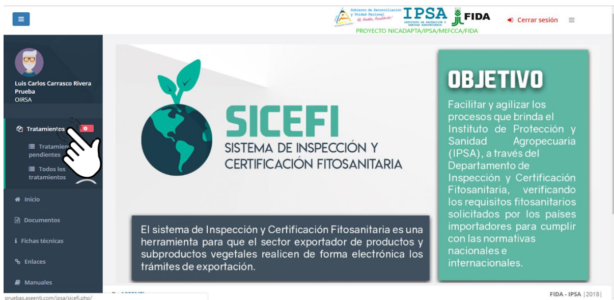
Figura 4. Ubicación del enlace disponible para administrar los registros de tratamientos.