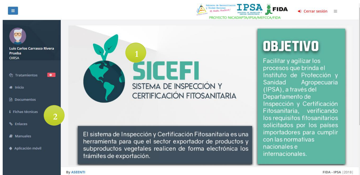
Figura 3. Ubicación de los módulos disponibles para gestión de actividad administrativa dentro del sitio web privado.

Si seguiste los pasos descritos anteriormente, el sistema web se encuentra listo para usarse y poder así comenzar con la captura de registros y envío de información.