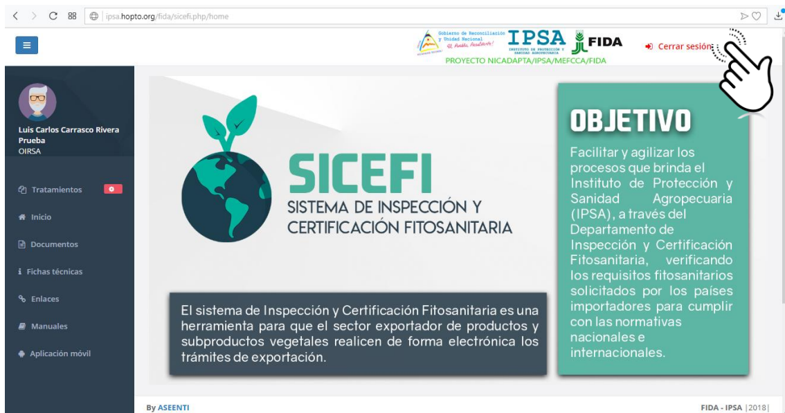
Figura 10. Ubicación del enlace para cerrar sesión dentro del sistema.

Tras finalizar con todas las actividades, es muy importante cerrar la sesión de usuario en la plataforma. Para esto, es necesario hacer clic en cerrar sesión para finalizar su actividad. Al cerrar sesión, se asegura de que ningún usuario tenga acceso a un nivel que no le corresponde. Después de cerrar sesión aparecerá la página de identificación de nuevo. Es necesario dar clic en el botón cerrar sesión que se encuentra ubicado en la parte superior derecha del sitio tal como lo muestra la figura 10.